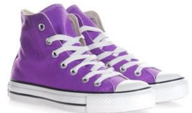
die lila Turnschuhe