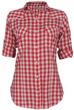
das karierte Hemd

Wir erinnern, wie die Kleidungsstücke im Deutschen heißen und was jetzt modisch ist.