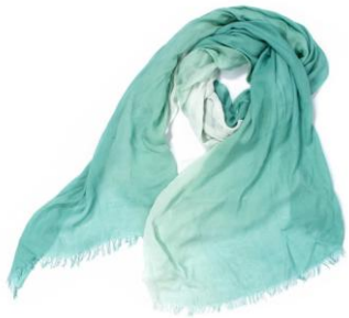
das hellblaue Halstuch