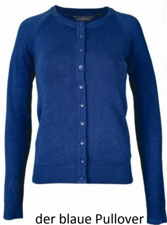
der blaue Pullover