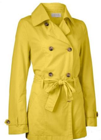
der gelbe Mantel