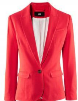
der himbeerroter Sakko