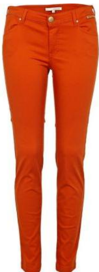
die orange Hose