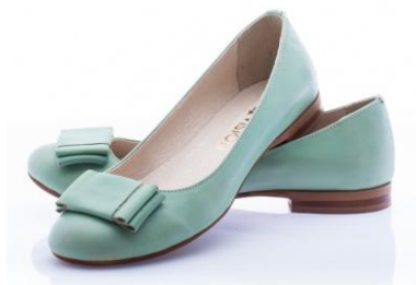
die schönen Ballerina