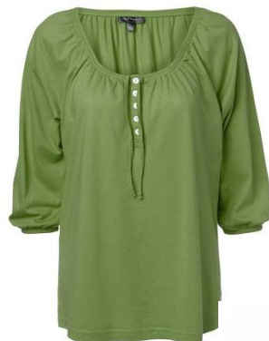
die grüne Bluse