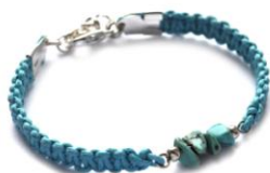
das modische Armband