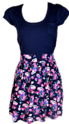
das Kleid mit Blumen