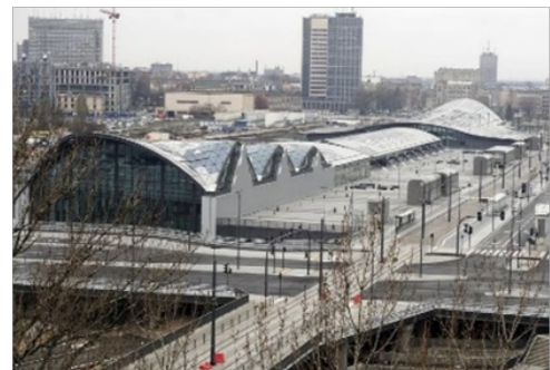
Dworzec Fabryczny obecnie

bez zatrzymywania się na stacjach po drodze. W Łodzi planowana jest również budowa kolejowego tunelu rednicowego, mającego przebiegać pod centrum miasta, który ma połączyć dworce Łódź Fabryczna i Łódź Kaliska, główne dworce miasta. Rozpoczęcie prac budowlanych planowane jest na 2018 rok, za ukończeniem przed 2022 rokiem, kiedy w Łodzi może odbyć się wystawa Expo.