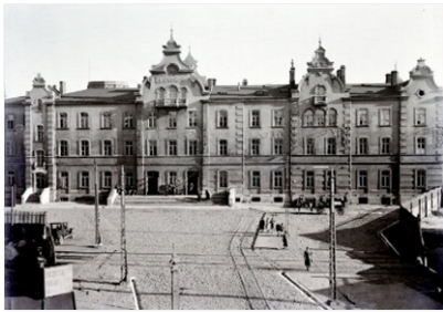
Dworzec Fabryczny w roku 1930

Jest to czołowa stacja kolejowa w Łodzi na linii do Koluszek, powstała z inicjatywy przemysłowca Karola Scheiblera w 1866r. Pierwszy pociąg wjechał oficjalnie do Łodzi 19 listopada 1865 roku. Uroczyste otwarcie kolei fabryczno-łódzkiej zaszczylił swój obecny sam namiestnik Królestwa hrabia Berg.