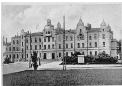
Dworzec Fabryczny 1939-45

Do I wojny światowej dworzec Łódź Fabryczna nazywany dworcem „warszawskim”, „wschodnim” lub dworcem Kolei Fabryczno-Łódzkiej. Nazwa „Łódź Fabryczna” pojawiła się w okresie międzywojennym. Podczas okupacji niemieckiej 1939–1945 nosił miano