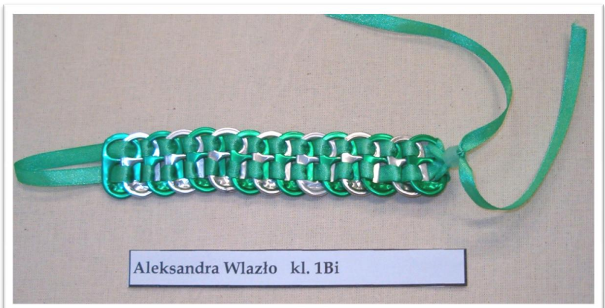
Aleksandra Wlazło kl. 1Bi