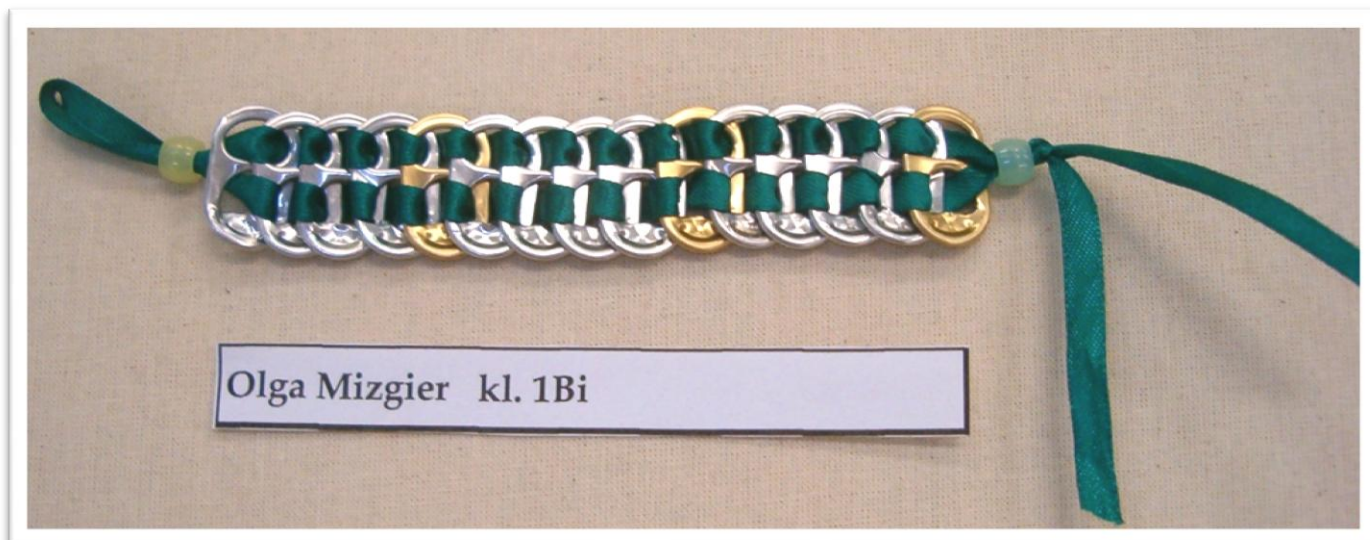
Olga Mizgier kl. 1Bi