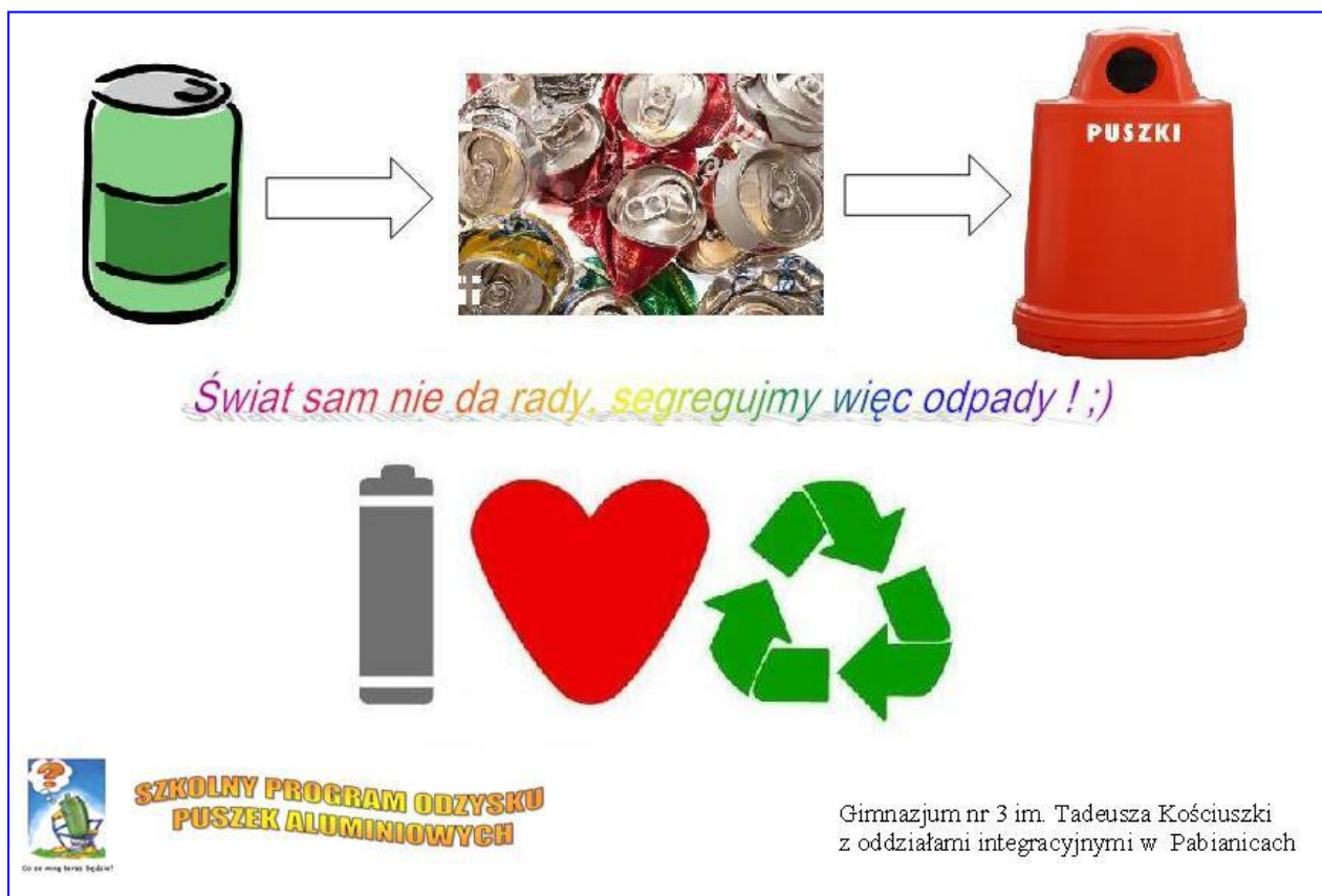
Patrycja Ludwisiak 2H