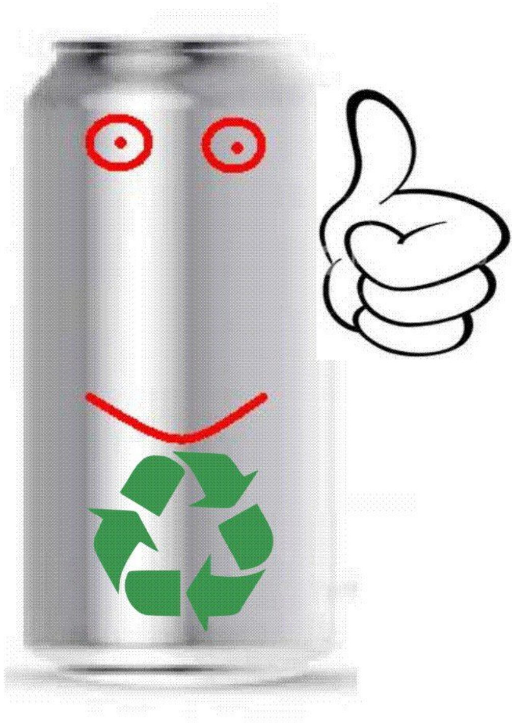
III miejsce - Amadeusz Bartosik 2Ai